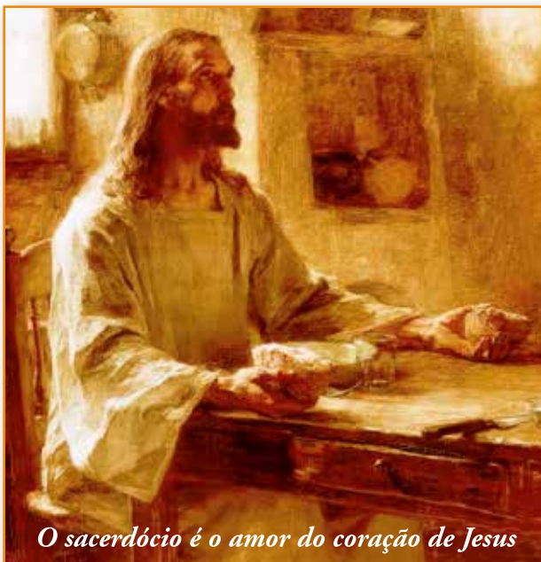
O sacerdócio é o amor do coração de Jesus